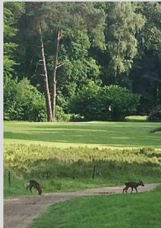
De kleine Capreolus op hole 9

Een persoon van ca 78 kilogram, maat 43 en het gewicht naar links geplaatst. Door het ontbreken van een softspike type black widow en de aanwezigheid van een andere softspike van het type tri-lock, blijken er